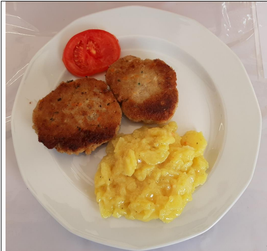
Selbstgemachte Fischkühle mit Fischen aus unseren Vereinsgewässern