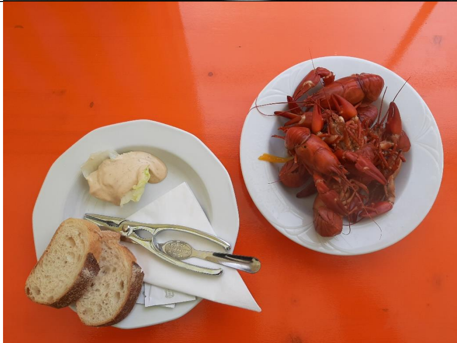
Flusskrebse aus der Iller